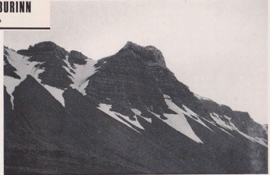
Skarðshorn. Ljós. Snævarr Guðm.

Aurrákir í snjósköflunum undir aðalveggnum, gefa til kynna að úr þessu hrynni, og að bergið sé laust í sér. En smáfiðringur í maga fær okkur til að standa upp og leggja af stað. Svo göngum við upp skriðurnar. Björgvin masar um aldur bergsins og tegundirnar sem mynda þennan kokkteil, sem fær heldur litlar undirtektir hjá mér, ekki síst þegar hann skriður um þetta rusl vegna einhverra steina sem eru svo óheppnir að vera í vegi hans. Hugsuð ykkur ef þið hefðuð legið í árþúsundir á sama stað, og svo kemur einhver furðuskepna sem tekur ykkur upp, þuklar á ykkur, þusar um fegurð ykkar og þeytir ykkur svo