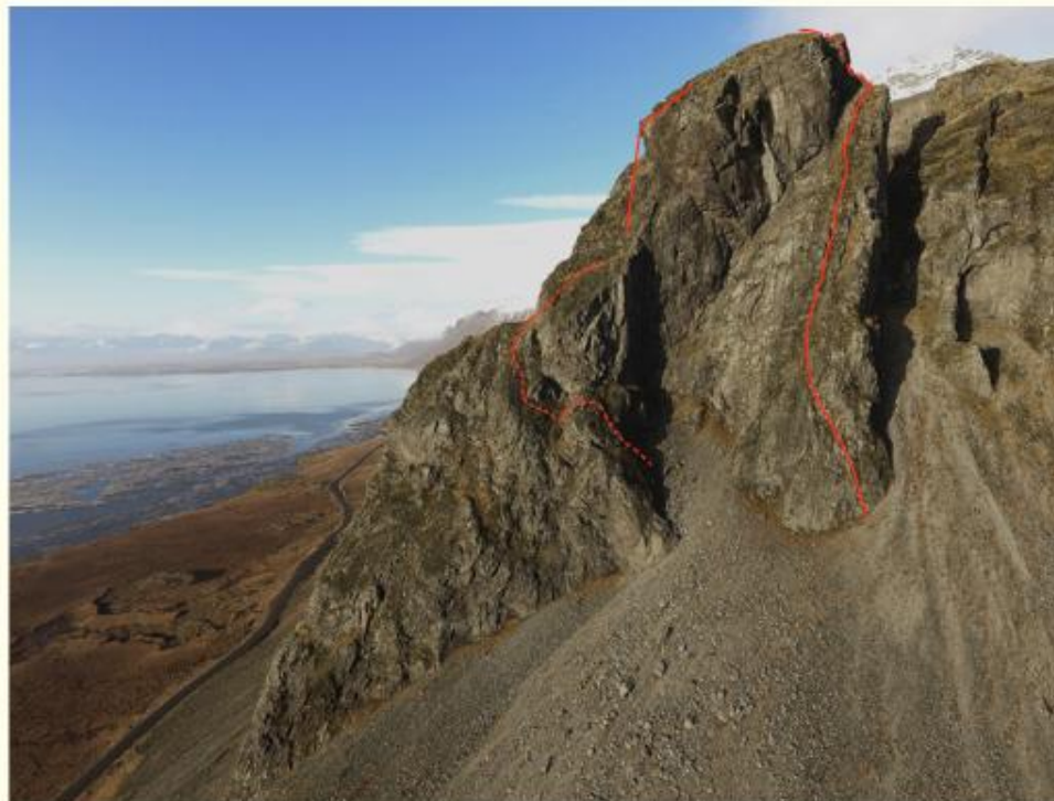
Mynd 3. Rustanöf í Vestrahorn. Línið er merkt. Nokkrum árum síðar hrundi gríðarstór bergfylla yfir slöbbin.

Deigi síðar var farið upp að Fallastakkanöf, ásamt Helga. Þetta var heiðrikjudagur en vindasamt og kalt þar sem sólin náði ekki til. Við ákváðum að reyna framanvert á nöfinni, skammt norðan við Orgelpípurnar, þar sem fremur áberandi sprunga vikkar, um 15 m ofan við rætur stuðlanna. Ég fékk það hlutverk að leiða fyrstu spönn, sem neðan frá leit út fyrir að vera fremur þægileg, miðað við þá fyrstu í Orgelpípurnum. Við höfðum sett af vinum (Friends) og hnetum til trygginga. Það kom okkur í opna skjöldu hversu erfitt hún var og tók meiri orku en áætlað var. Ég var í raun feginn að ná að klára hana án þess að detta eða setjast í línuna loks þegar ég komst upp fyrir þrepin. Doug var hins vegar fljótur upp og það var ekki að sjá að hann klifraði með sömu fyrirhöfn og ég.