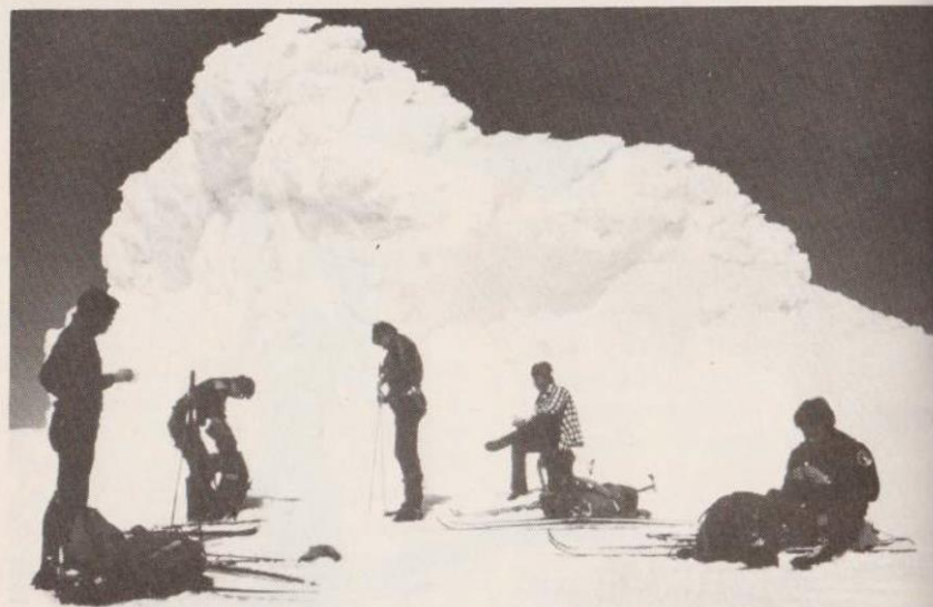
Alpaklúbbsmenn spóka sig í sólinni við Godastein (Guðnastein?).