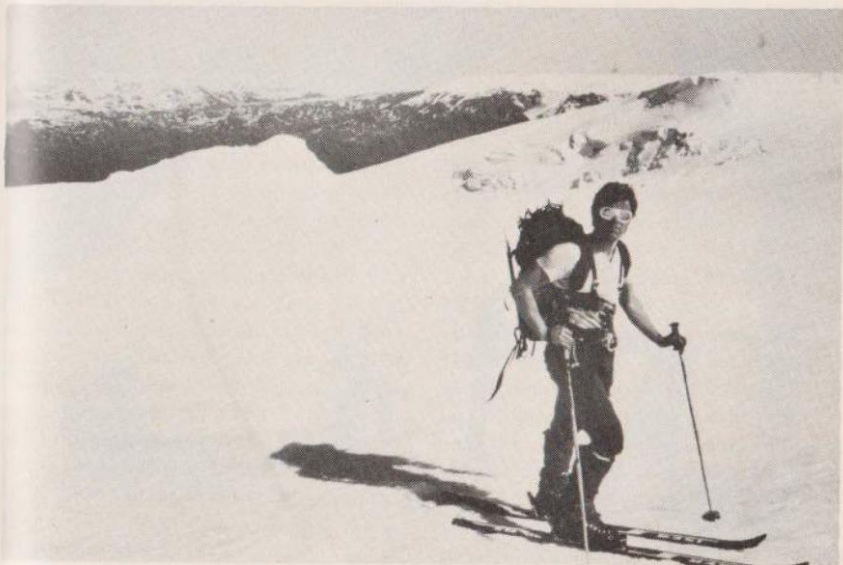
Í blíðuveðri á Eyjafjallajökli, Fremri- og Innri-Skoltur og fjær sér í Mýrdalsjökul og Torfajökulssvæðið. Ljós. Guðjón Ó. Magnússon, maí 1981.