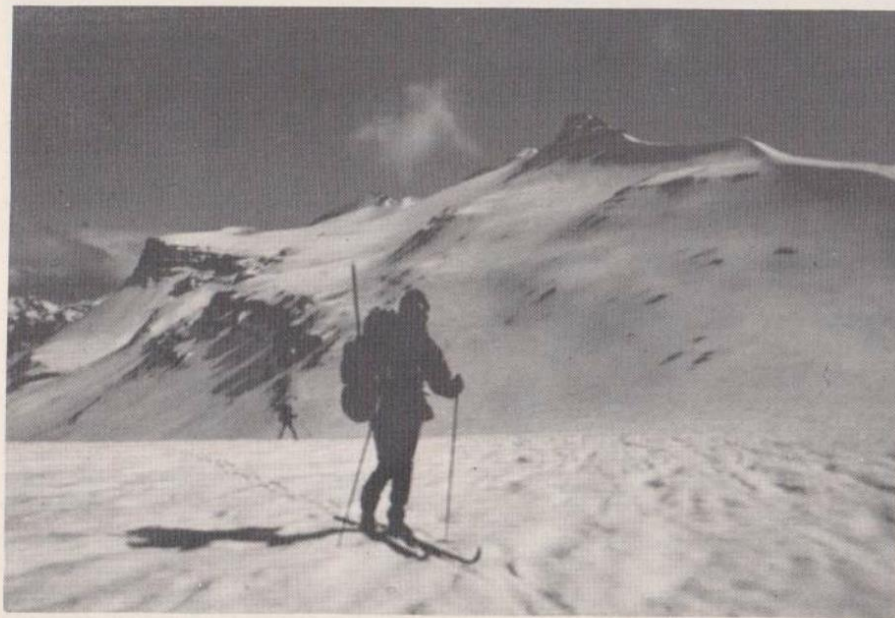
Grasiljatindur (1275 m).