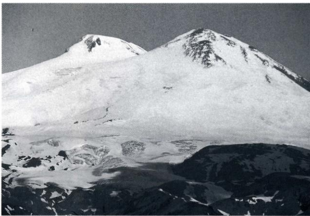
Elbrus í Kákasusfjöllum. Aftari tindurinn er sá hærrí.