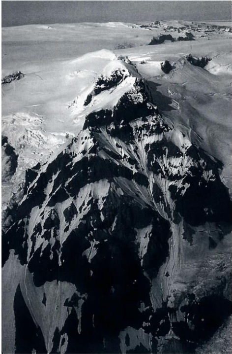
Eystra-Hrútsfjall, suðurhlíðin. Stórágil er hægra megin við miðja mynd.

tindunum eftir greiðfærri snjósyllu er lá upp í skarðið á milli Sudur- og Miðtinds. Úr skarðinu var farið á Miðtind en upp hann var klifið að vestanverðu meðfram ísudum klettum. Þegar Arnór og Helgi héldu af tindinum var tekið að skyggja.