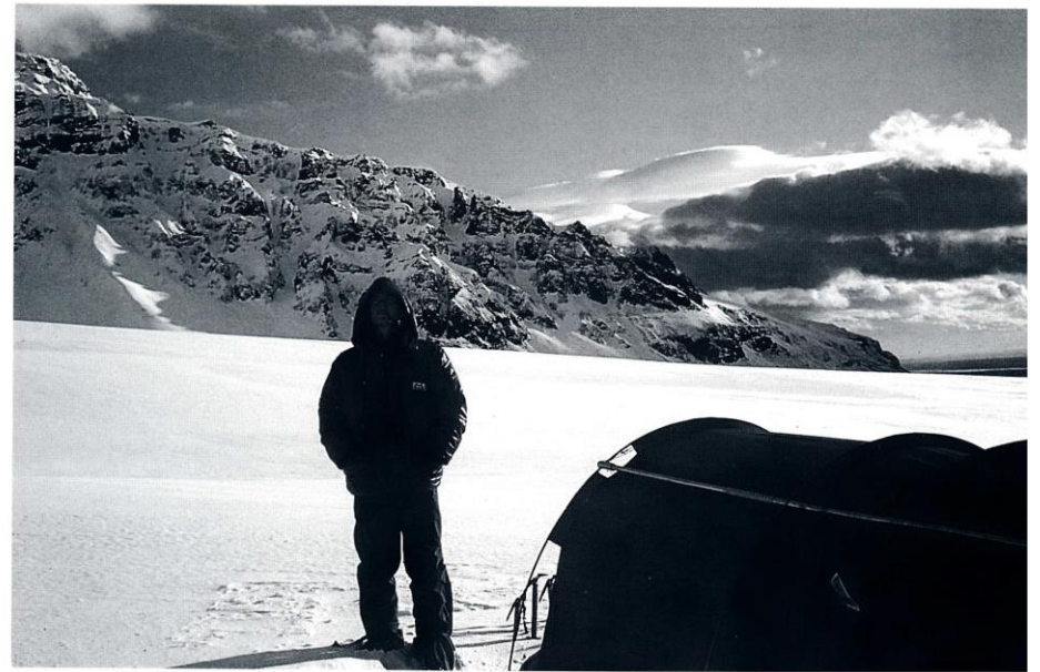
Greinarhöfundur á Svínafellsjökli, um páska 1980.

Morguninn eftir, þann 12. maí, var óbreytt veður og því þótti ekki ráðlegt að fara niður sömu leið enda mátti búast við að hún væri orðin hættuleg eftir öll hlýindin. Var haldið áleiðis að Vesturtindi. Sá spölur var varhuga-verður því lítið sást manna á milli í þokumollunni og sprungur voru við hvert fótmal. Þau náðu tindinum í niðarþoku og blindu en þar var staldrað stutt við heldur leitað niðurleiðar. Í fyrstu gekk það illa því ekki fannst rétta leiðin en þá rofaði í þokuhuluna í eitt órlítið augna-