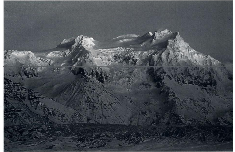
Hrútsfallstindar, Svínafellsjökull í forgrunni. Gvendargil sést efst til vinstri á myndinni.

komid hafði á Örafajökul um nóttina var að eyðast upp og sól tekin að skína. Eftir drjúga göngu var komid upp á hnúk í 1040 m hæð sem er framanvert við Hrútsfjallið. Leiðin lá þá yfir nedanverðan Hrútsfjallsjökul og upp í hliðarnar vestan hans þar sem léttustu leið upp gildrag (nú oft nefnt Gvendargil, eftir Guðmundi Péturssyni, gráðað F) var fylgt. Þegar dró úr bratta komu þeir upp á Hrútsfjallið vestan við Vesturtind, í að giska 1300 m hæð. Fóru þremmingarnir eftir kambinum að og svo norður fyrir tindinn en þar er styst upp á hann. Stóðu þeir á Vesturtindi laust eftir hádegi, í sól og góðu skyggni, nokkru frosti og golu. Þar var tekin ákvörðun um að halda til Eystra-Hrútsfjalls þar sem þeir álitu hentuga niðurleið vera.