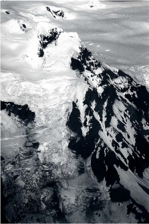
Eystra-Hrútsfjall, suðurhlíðin.

margra dæma þegar veðrið tekur öll völd af mannlegum mætti á þessum slóðum þó fleiri hafi ekki fokið niður af fjallinu. Varhugað er að óvæntum veðrum geta fylgt slæmar villur. Snjór og himinn renna saman í eitt og slík getur blinda orðið að ekki er hægt að gera sér grein fyrir hvort gengið sé niður eða upp. Á fjalli eins og Hrútsfjalli eru slíkar aðstæður alvarlegar, vegna þess að víða liggja leiðir nálægt þverhniðisbrúnum. En sýnt þótti að á Hrútsfjalls-tinda var hægt að sækja heilmikil ævintýri og reynslu í fjallamennsku. Fjallið var að mestu ókannað og þar var einn tindanna, það er Suðurtindur, enn óklifinn. Frá Svínafellsjökli upp á hæstu egg tindsins er um 1400 m hækkun en sá hluti sem tilheyrði Eystra-Hrútsfjalli er brött og víðáttumikil fjallshlíð.