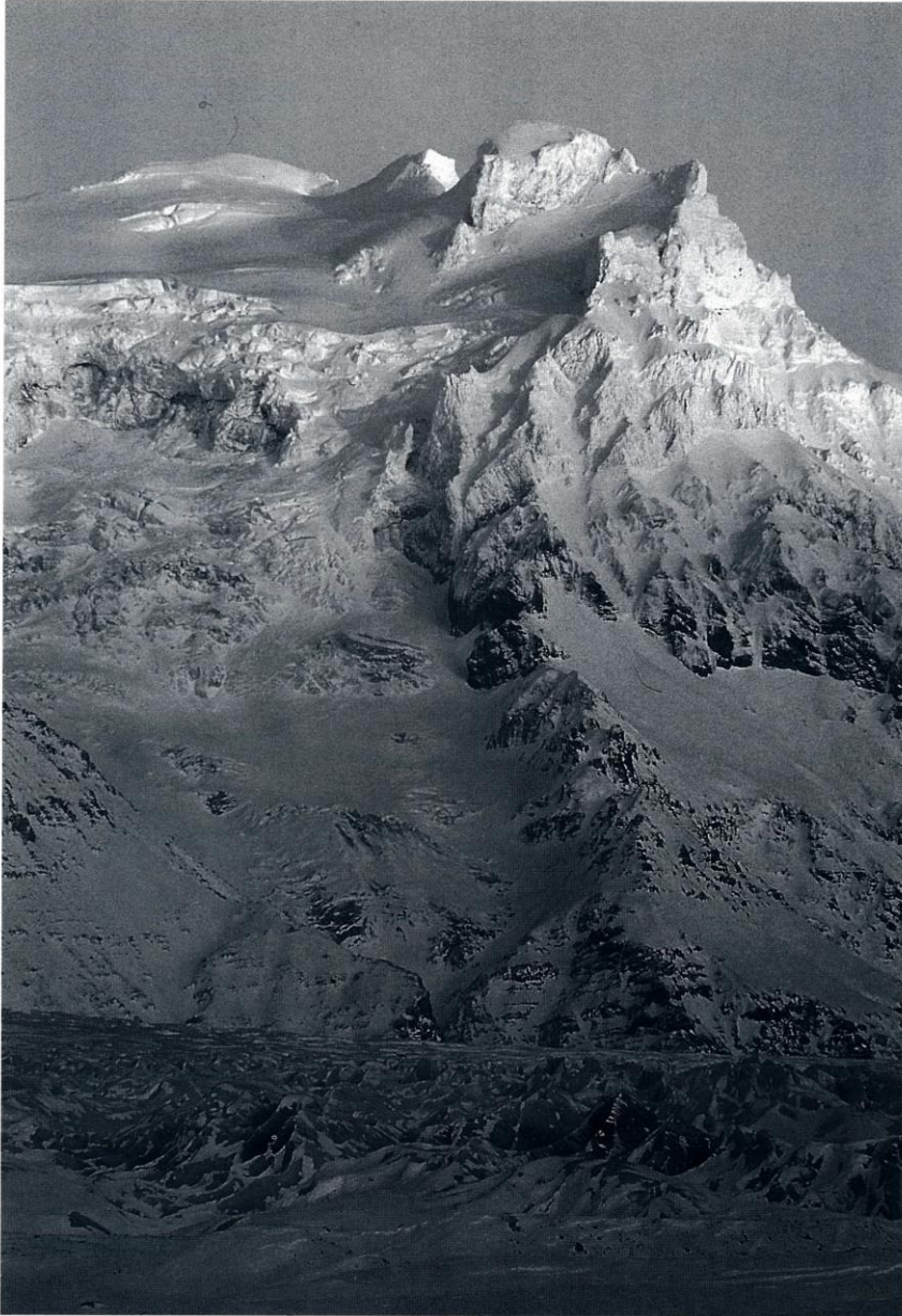
Hrútsfjallstindar í vetrarham.

en hér hefur verið sagt frá og að eins sé víst að einhverjar upptalinn leiða hafi verið oftar farnar en hér segir frá, jafnvel fyrr en hér greinir. Flestar leiðir á Hrútsfjallstinda eru ekki erfðar uppgöngu á nútíma mælikvarða en krefjast þó kunnáttu á helstu tæki og tól sem meðferðis þarf. Ísöxi, mannbroddar og lína verða að teljast lágmarksútbúnaður en ýmislegt annað þarf að fylgja á leiðum sem gráðaðar eru PD og ofar. Ef gengið er upp Svínafellsjökul á fyrsta degi er álitlegast að tjalda eða leita vars á urðarrananum undir Vestara-Hrútsfjalli. Þar er tilvalið að geyma útbúnað sem ekki þarf með í sjálfri fjallgöngunni. Frá urðarrananum er stutt að flestum leiðunum sem hefjast frá Svínafellsjökli. Að komast á einn eða alla Hrútsfjallstindana er verkefni sem flestir fjallamenn ættu að stefna á. Heimsókn á þessar slóðir kemur ætíð til að standa upp úr og flokkast með betri göngu- eða klifurferðum sem hægt er fara hérlandis.