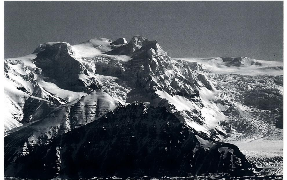
Hrútsfjall, Hafrafell í forgrunni.

fjallið. Hryggur Eystra-Hrútsfjalls, sígildasta uppgönguleið á fjallið, var tvívegis genginn árin 1990 og 1991 en í hvorug skiptin náðust tindar. Um páska 1991 fóru félagar úr Kópavogi á Hátind eftir að hafa klifið Kirkjuna nokkru fyrir. 26)