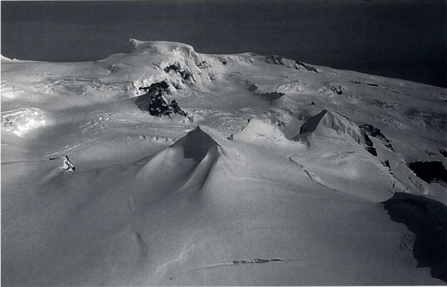
Loftmynd af Hrútsfjallstindum. Frá vinstri talið Hátindur, Mið- og Sudurtindur. Vesturtindur sést neðst til hægri. Að baki eru Hvannadalshnúkur og Kirkjan.

ungneytarekstur og skógartóft. 2) Má geta að auk þessa álíta sumir gamla arfsögn frá miðöldum styðja þá tilgátu að fyrstum hafi í dalnum á milli Hafrafells og Svínafells verið lyngi og skógi vaxnar öldur áður en jöklum óx ásmegin. 3) Í sýslu- og héraðslysingum frá 18. öld hafa jöklararnir þegar gengið fram og Hafrafell sagt ónot hæft til beitar vegna þessa. 4)