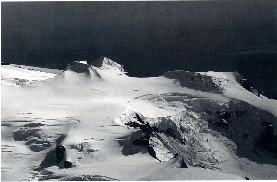
Hrútsfallstindar úr lofti, leiðin niður í Sveltiskarð sést t.h. niður af Vestara-Hrútsfjalli.