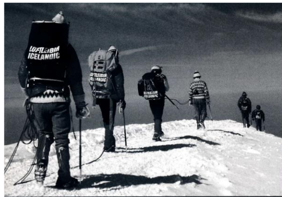
Á Mt. Blanc 1973.

til Chamonix, að koma í virkilegt fjalla-andrúmsloft?